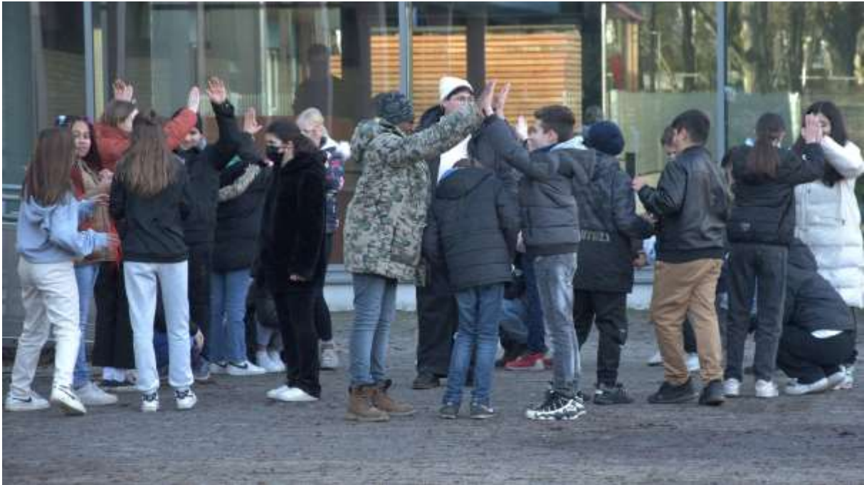
Der Demokratieworkshop des Internationalen Bundes schult die Selbstreflexion und den respektvollen Umgang.