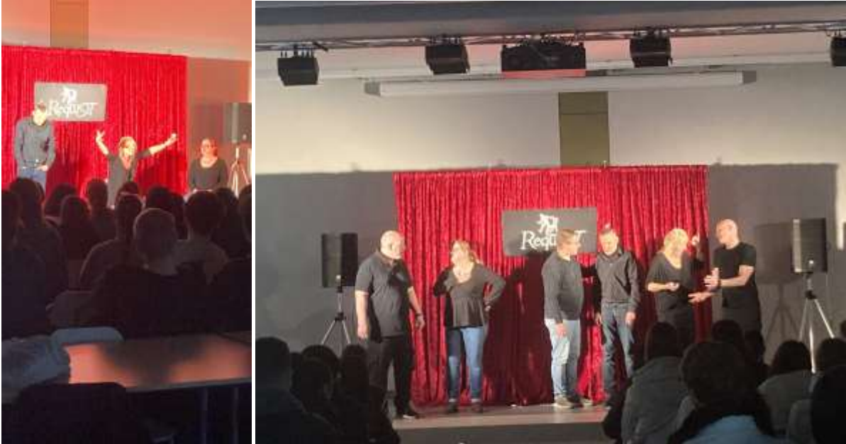
Suchtprävention mit dem von der R+V-Versicherung geförderten „Theater RequiSiT“.