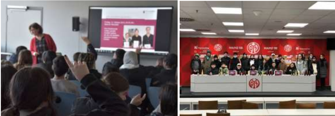
Die Polizei Mainz informiert über strafrechtliche Folgen von Cybermobbing und zeigt Beispiele von Zivilcourage. Im 05er-Klassenzimmer geht es um gesunde Ernährung. Die Deutsche Herzstiftung e.V. klärt über Risiken des Rauchens auf.