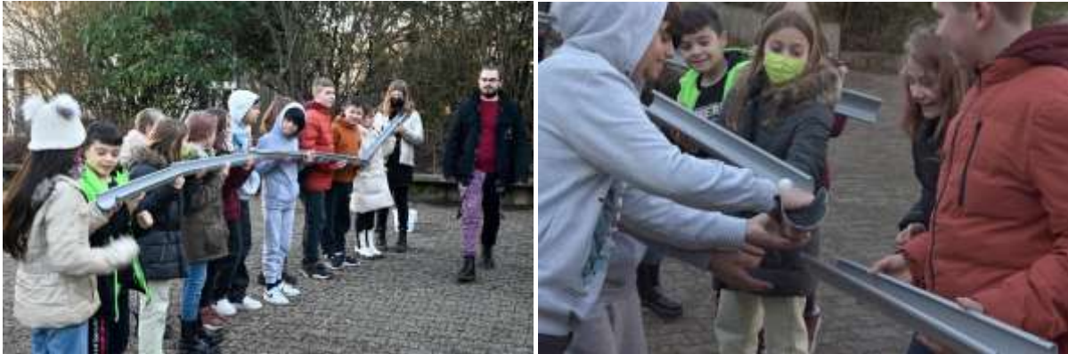
Im Projekt "Gemeinsam Klasse sein" steht das Stärken der Gruppendynamik im Fokus.